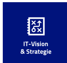
IT-Vision & Strategie

Für ein objektives und ganzheitliches Bild Ihrer IT, analysieren und bewerten wir entlang der vier Dimensionen «IT-Vision & Strategie», «IT-Organisation & Governance», «IT-Infrastruktur & Technologie» und «IT-Business Impact» den Reifegrad Ihrer Unternehmens-IT: