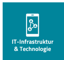
IT-Infrastruktur & Technologie

Eine gut strukturierte IT-Organisation und effektive IT-Governance sind von grosser Bedeutung, um die Effizienz, Sicherheit, Compliance und Anpassungsfähigkeit der IT-Abteilung sicherzustellen. Deshalb analysieren wir die IT-Organisation & Prozesse, betrachten das IT-Leadership, bewerten das IT-Business Alignment sowie die IT-Governance & Compliance.