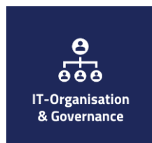
IT-Organisation & Governance

Um den Erfolg und die Effektivität der IT-Abteilung sicherzustellen und Ihr Unternehmen auf die nächste Stufe der digitalen Transformation zu führen, ist eine IT-Vision & Strategie nötig. Wir analysieren die Ausrichtung, Ziele und Prioritäten der IT und prüfen, ob die IT-Vision & Strategie im Einklang mit den übergeordneten Unternehmenszielen ist.